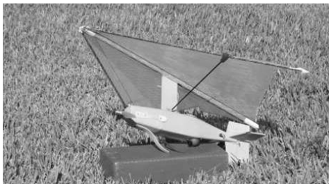
Abb. 4: MicroBug, Cyberdefence ( www.cyberdefensesystems.com )

Schon seit längerem sind für die Fernerkundung ferngelenkte Luftfahrzeuge im Einsatz, die leichter als Luft sind, ähnlich einem Zeppelin, siehe Abb. 7. Mit den gegenwärtigen Möglichkeiten zur Überwachung der Lage und der Position lassen sich diese nun auch völlig autonom fliegen. Mit ihnen können sehr lange Flugzeiten und große Flughöhen erreicht werden. Entscheidende Nachteile sind die geringe Flexibilität und die Windanfälligkeit.