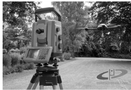
Abb. 3: MD4-200 und Trimble S6

Um die Zuverlässigkeit des Tachymetertrackings beurteilen zu können, wurde ein umfangreicher Testflug durchgeführt, der auch schnelle Änderungen der Flugrichtung und kurzzeitige Unterbrechungen der Sichtverbindung zwischen Tachymeter und UAV enthielt. Als Ergebnis dieser Untersuchung konnte festgestellt werden, dass bei üblichen Flugmanövern und nur kurzzeitiger Unterbrechung der Sichtverbindung ein zuverlässiges Tachymetertracking des Flugobjektes möglich ist. Wenn nun noch die Teilaufgabe „Datenkommunikation“ gelöst wird, kann eine Präzisionsnavigation mittels Tachymetersteuerung realisiert werden, wobei eine Positionsgenauigkeit im Bereich weniger Millimeter zu erwarten ist. Diese Steuerung würde einen autonomen Einsatz von UAVs im Indoor-Bereich (z.B. in Werkshallen) ermöglichen und somit einen weiteren Anwendungsbereich erschließen.