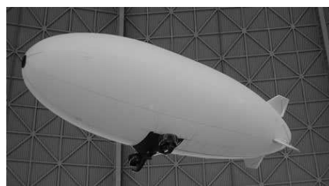
Abb. 7: AEC1000, SkyshipsRemote ( www.skyshipsremote.com )