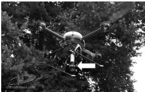
Abb. 2: MD4-200 mit Minirundprisma

Die Teilaufgabe „Tachymetertracking“ wurde am i3mainz im Rahmen einer Bachelor-Arbeit mit freundlicher Unterstützung der microdrones GmbH und der Firma Geosysteme GmbH untersucht. An dem für die Untersuchung bereitgestellten UAV MD4-200 wurde ein Minirundprisma befestigt, siehe Abb. 2, das nach dem Abheben des UAV mit einem zielverfolgenden Tachymeter der Baureihe Trimble S6 im „Tracking-Modus“ angezielt wurde, siehe Abb. 3. In diesem Modus wird das Prisma in der Bewegung verfolgt und es werden fortwährend dessen 3D-Koordinaten im Instrumentensystem berechnet. Der Abdruck der Abb. 2 und 3 erfolgte mit freundlicher Genehmigung der microdrones GmbH.