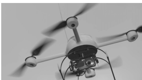
Abb. 6: MD4-200, Microdrones ( www.microdrones.com )