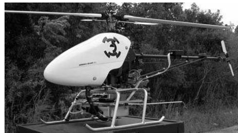
Abb. 5: SR20, Rotomotion ( www.rotomotion.com )